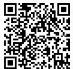
Pasin Palstat - kirjasto