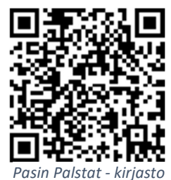
Pasin Palstat - kirjasto